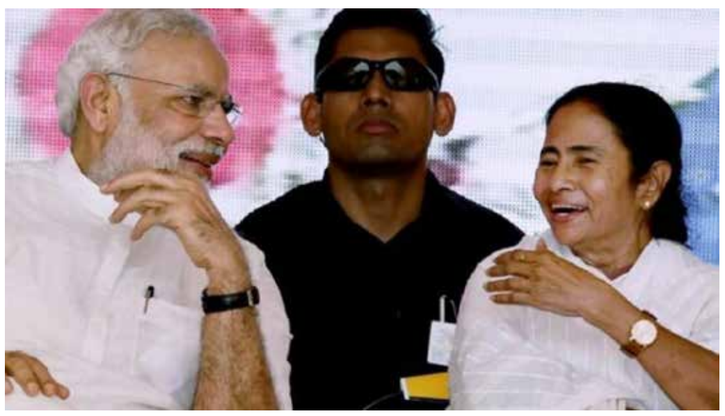
പ്രതിപക്ഷ സൗഹൃദം പരാമർശിച്ച് പ്രധാന മന്ത്രിയുടെ അഭിമുഖം.