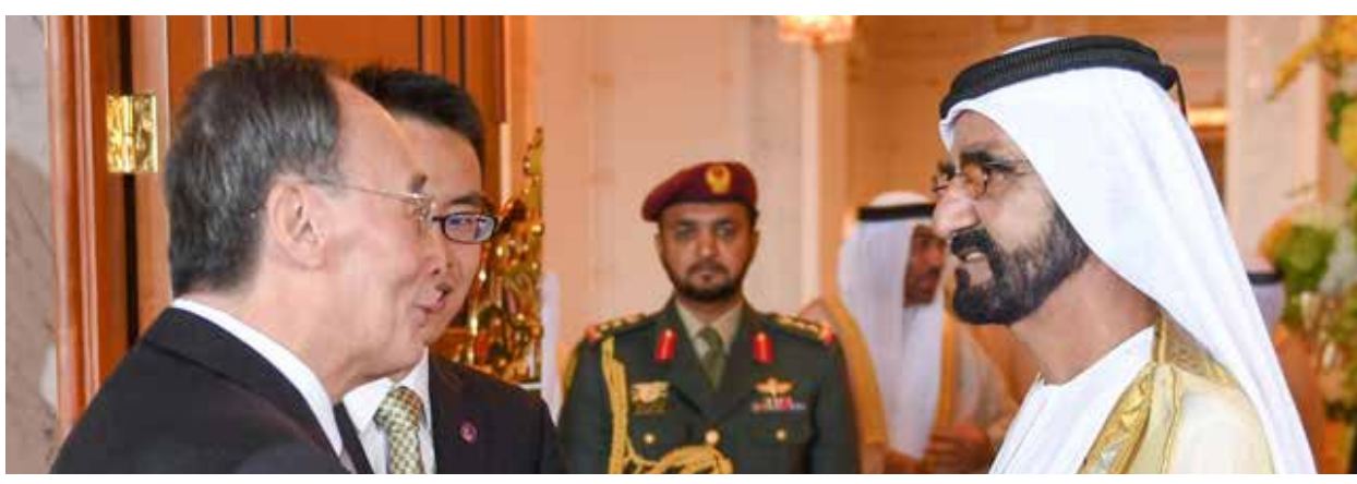
ചൈനയെ റോഡ് - കടൽ മാർഗം മറ്റ് രാജ്യങ്ങളെ ബന്ധിപ്പിക്കുന്ന സ്വപ്ന പദ്ധതി ചർച്ച ചെയ്യപ്പെടുന്നു.